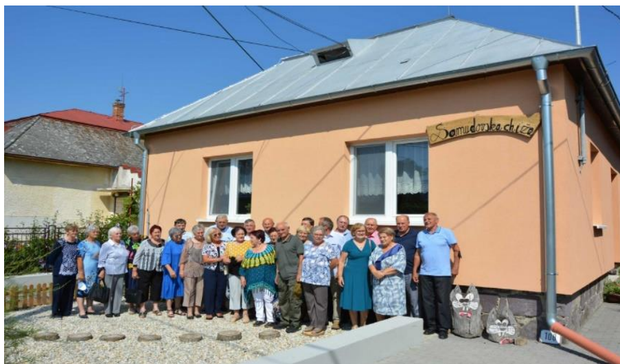
Stretnutie rodákov z obce august 2021