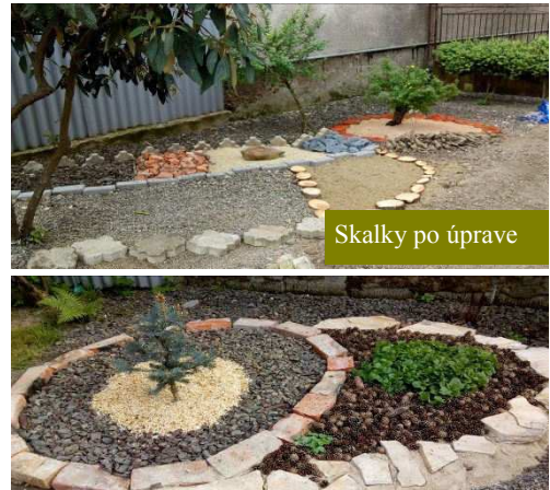
Skalky po úprave