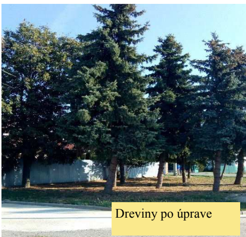
Dreviny po úprave

Rokmi neudržiavané dreviny pred budovou komunitného centra si vyžiadali v jarnom období náležitú úpravu. Za pomoci motorovej píly boli upravené jednotlivé stromy pred budovou s cieľom predĺžiť ich životnosť, zlepšiť a optimalizovať ich zdravotný stav a zvýšiť prevádzkovú bezpečnosť. Počas úpravy