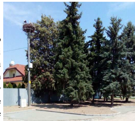
Dreviny pred úpravou

boli odstránené vysychajúce a suché konáre, poškodené a zlomené konáre so zníženou stabilitou, konáre ktoré boli napadnuté škodcami, nevhodné konáre vrastajúce do koruny a upravené boli aj kostrové konáre. Vykonaním týchto úkonov sa docielilo presvetlenie a prevzdušnenie celej plochy a docielili sme zdravší vzhľad stromov. Pred budovu boli dovezené aj staré betónové kvetináče, ktoré sa očistili, namaľovali a boli do nich vysadené okrasné rastliny. Zrealizovaním týchto úkonov bol skrášlený celý priestor pred budovou.