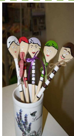
Krúžok - varíme, pečieme