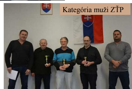
Kategória muži ZŤP