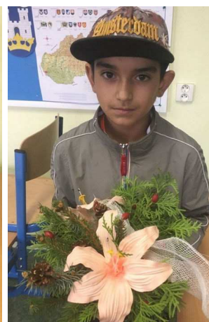
Krúžok - šikovné ruky