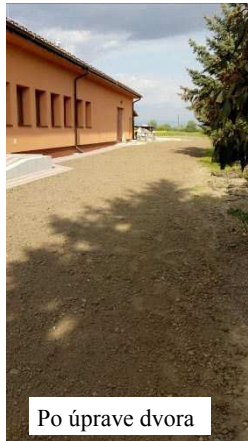
Po úprave dvora