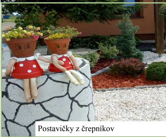
Postavičky z črepníkov